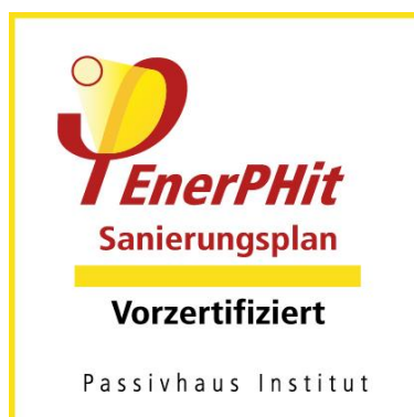
Siegel Vorzertifizierung für schrittweise durchgeführte Modernisierungen

Die Siegel dürfen ausschließlich in eindeutigem Zusammenhang mit dem zertifizierten Gebäude verwendet werden.