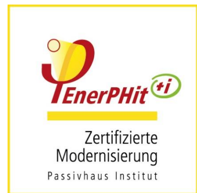
EnerPHit + -Siegel (für Gebäude mit überwiegender Innendämmung)